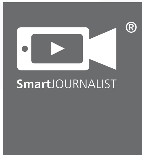
Videoproduktionssystem für die Bewegtbild-Kommunikation